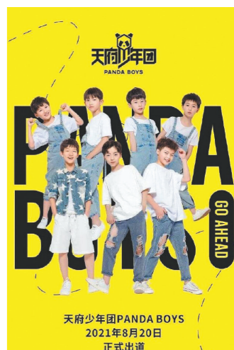
“天府少年团”昙花一现

24日凌晨,该公司宣布天府少年团更名“熊猫少儿艺术团”,并表示公司“不做饭圈文化,没有资本运作”。24日,公司宣布天府少年团解散。