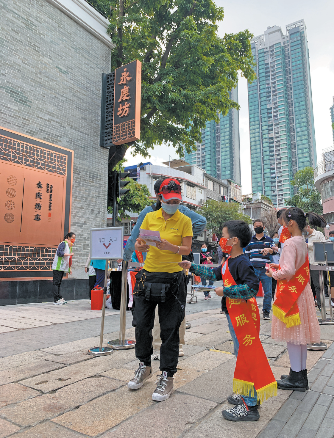
广州城市旅游问讯救援服务中心开展“花城好家风·i暖天下客”志愿服务活动