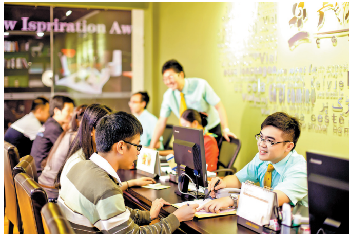
广之旅太阳新天地门店服务日常

在广东省内各大景区景点开展的旅游信息宣传及文明出行引导等志愿服务活动中,为高峰期的旅游服务提供了保障,也擦亮了广东文明旅游的名片。下一步,广东省文化和旅游厅将加速文化和旅游志愿服务融合发展,加强优秀志愿项目培育,提升文化和旅游志愿服务影响力,同时还将鼓励社会力量参与,扩大文化和旅游志愿服务覆盖范围,让志愿服务更加规范化、专业化、科学化。