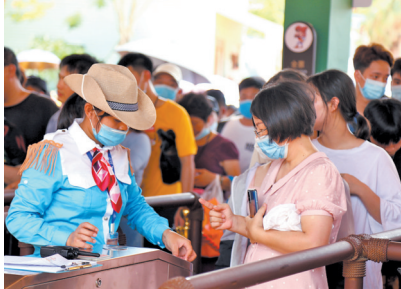
疫情之下,广东各地景区严格防疫,加强服务

劣。同时,优质的旅游服务更应带有温度,“这种温度就体现在如何做细、做小。”记者了解到,近年来广东省内大型综合性景区持续增多,而随家庭游客为首的深度休闲度假需求的攀升,游客在景区内停留的时间大为延长,“两天一夜”“三天两夜”甚至更长的亲子游越发常见,老人、小孩的出行比例更高。在未来,完善的医疗保障服务也将成为提升景区服务品质不可或缺的重要环节。