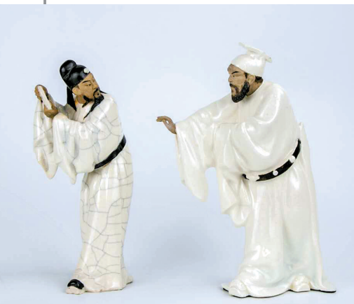
▲刘传石湾陶塑作品《孟浩然》 上世纪五十年代 新石湾美术馆藏品