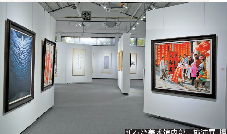
新石湾美术馆内部

佛山,肇迹于晋,得名于唐,位于珠三角文化腹地,拥有深厚的文化积淀与历史底蕴。作为国家级历史文化名城,佛山是广府文化的发祥地之一,粤剧、陶瓷技艺、武术、狮舞、佛山木版年画等众多非遗技艺,传承了历史,惊艳了时光;200多家博物馆及美术馆于市内星罗棋布,“博物馆之城”实至名归。这当中,佛山民营博物馆是推动艺术普及化的一股重要力量。 美术馆和城市的文化发展活力。日益发展的佛山民营博物馆,如何在润物细无声中提升城市文化品位,让美育教育在公众中得以普及?本期《名家话收藏》请来佛山市博物馆理事、广东省新石湾美术馆创办人、佛山陶塑作品及满洲窗收藏家范绍辉,多角度分析了民营博物馆的发展之路及其丰富的收藏心得。而以非营利、公益性的方式去运营民营美术馆,传播优秀岭南文化,更是这位低调的本土企业家一直践行的初心。