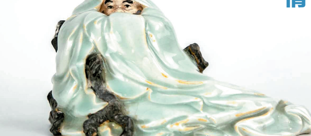
▲刘传石湾陶塑作品《孟浩然》 上世纪五十年代 新石湾美术馆藏品

羊城晚报记者:在您的藏品中,石湾陶塑和满洲窗是两个重要门类,都与岭南文化相关,为什么会如此对这两方面的收藏感兴趣?为什么会有如此浓厚的岭南文化情结?