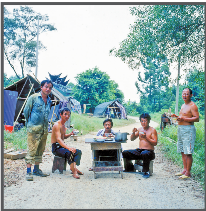
2003年，探测地质的工人在用午餐