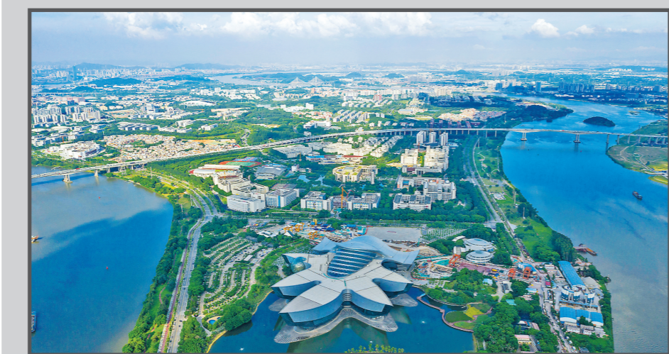
2021年8月30日航拍的大学城