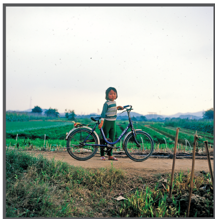
2002年，当地女孩推单车经过田野