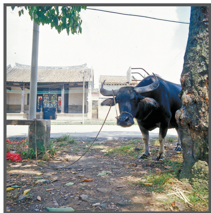
2002年，一头牛在祠堂前张望