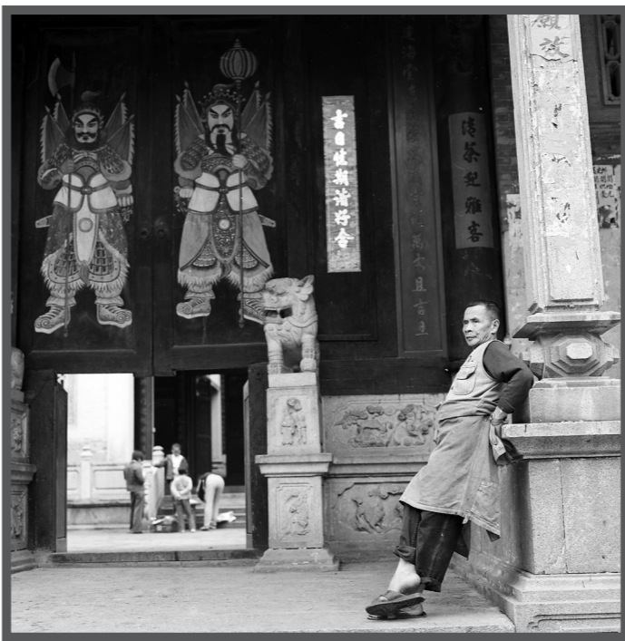
2002年，老人在祠堂门口晒太阳