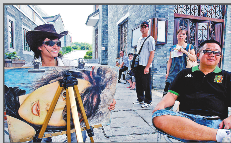
小谷围旧建筑重新组合，成为时尚景点岭南印象园