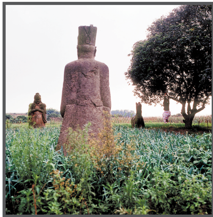
明代曾豫斋墓神道石立像原貌