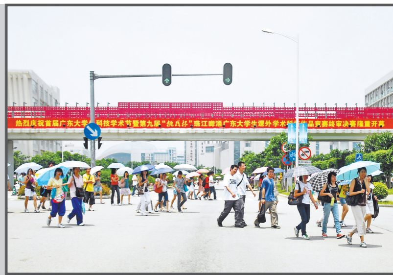
2004年，大学生成为小谷围的新主人