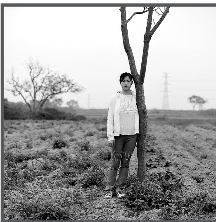
一位广州中学生来到未来的大学城先体验一下