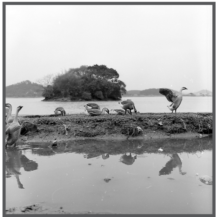
2002年，鹅在珠江边展翅