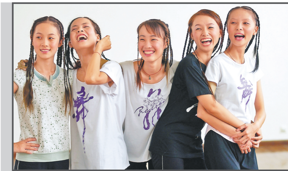
2004年，广州大学女生。这是广州大学城的第一批大学生