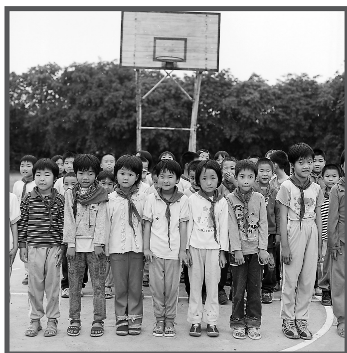
2002年，小谷围小学生在操场合照