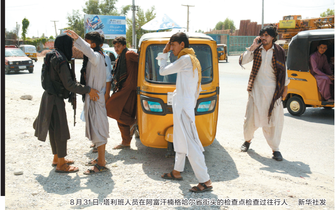
8月31日，塔利班人员在阿富汗楠格哈尔省街头的检查点检查过往行人