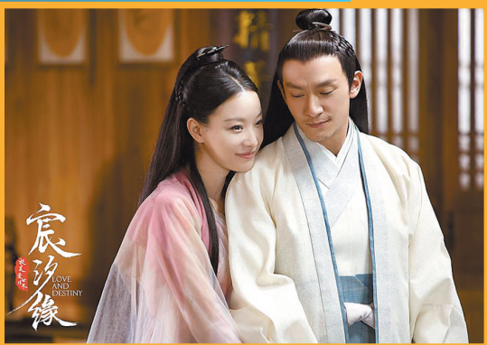
“饭圈”逻辑只关注演员的年龄、造型

▲“顶流”蔡徐坤的新专辑《迷》售卖4个多月,列表中11首歌才上线5首,而专辑售卖金额已超8000万元。29日被媒体和网友质疑后,30日其专辑剩余新歌全部上线