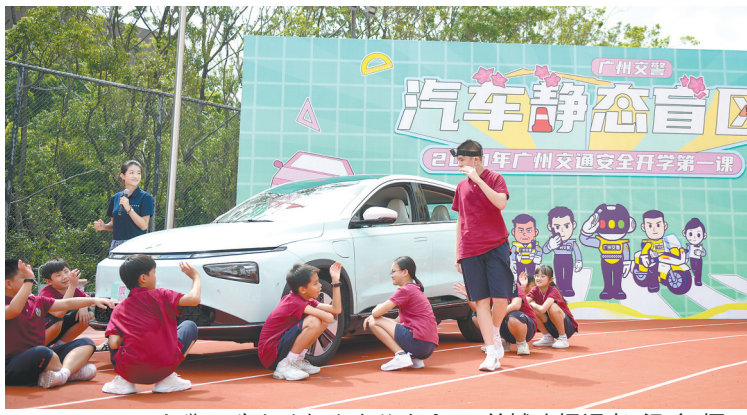
交警给学生讲解汽车静态盲区

课堂上最精彩的莫过于4个“瞬间重现”的场景:特技演员表演了《危险,勿做“低头族”》《远离“内轮差”盲区》《专心骑行不分心》《马路不是赛道》等节目,再现交通事故的发生瞬间。数据显示,近年来,全国每年约有2万多名少年儿童在交通事故中伤亡。其中,不按信号灯通行、过马路时玩手机、不规范骑行等是重要的交通隐患因素。