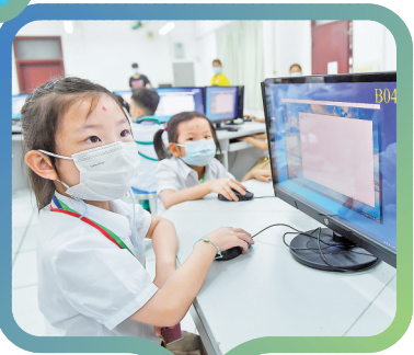
小学生参加校内素质课程