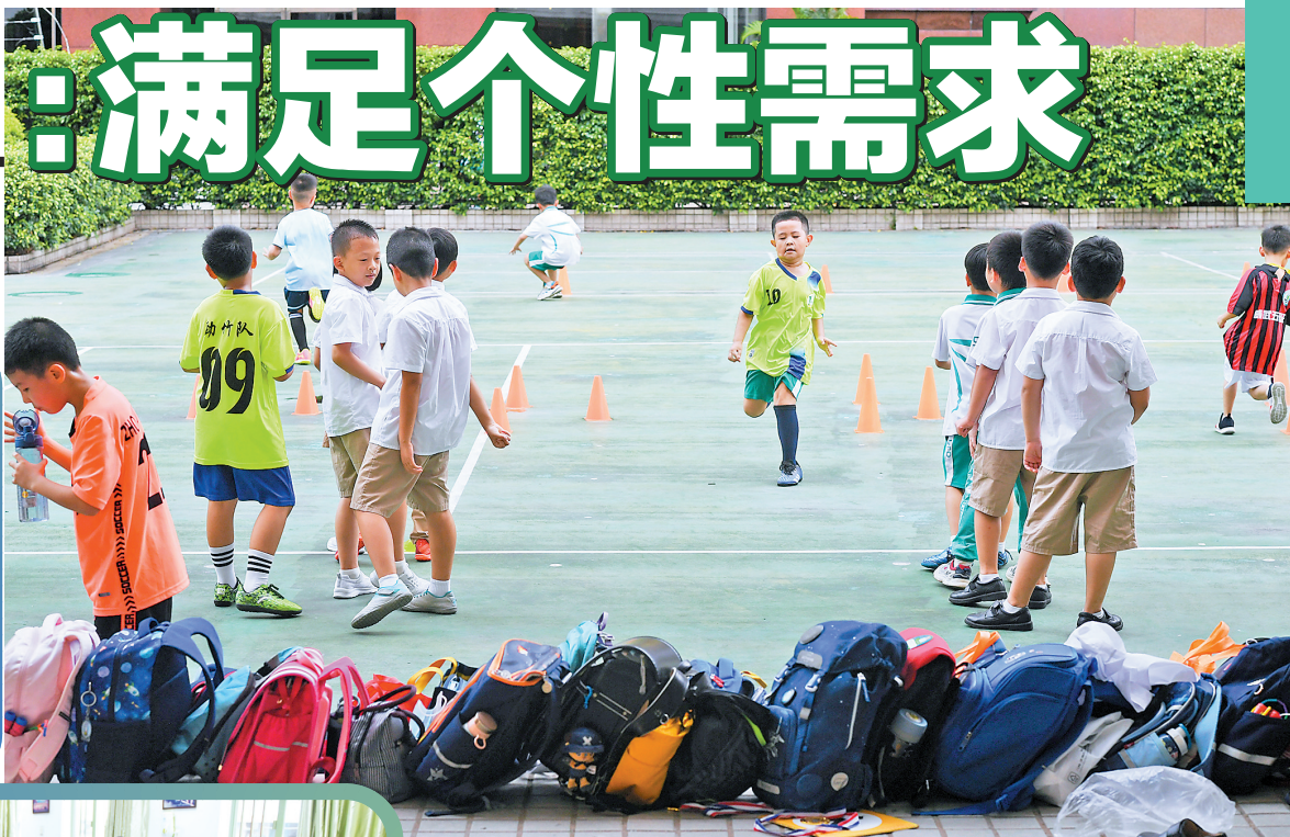
东风东路小学锦城花园校区,足球队的学生放学后参加训练

羊城晚报记者走访多所学校了解到,课后服务方面,不少学校提前调查家长需求,为学生提供丰富的基本托管和素质课程;但中午午休,一些学校受制于场地等原因孩子只能趴桌午休,让家长担心孩子的身体。