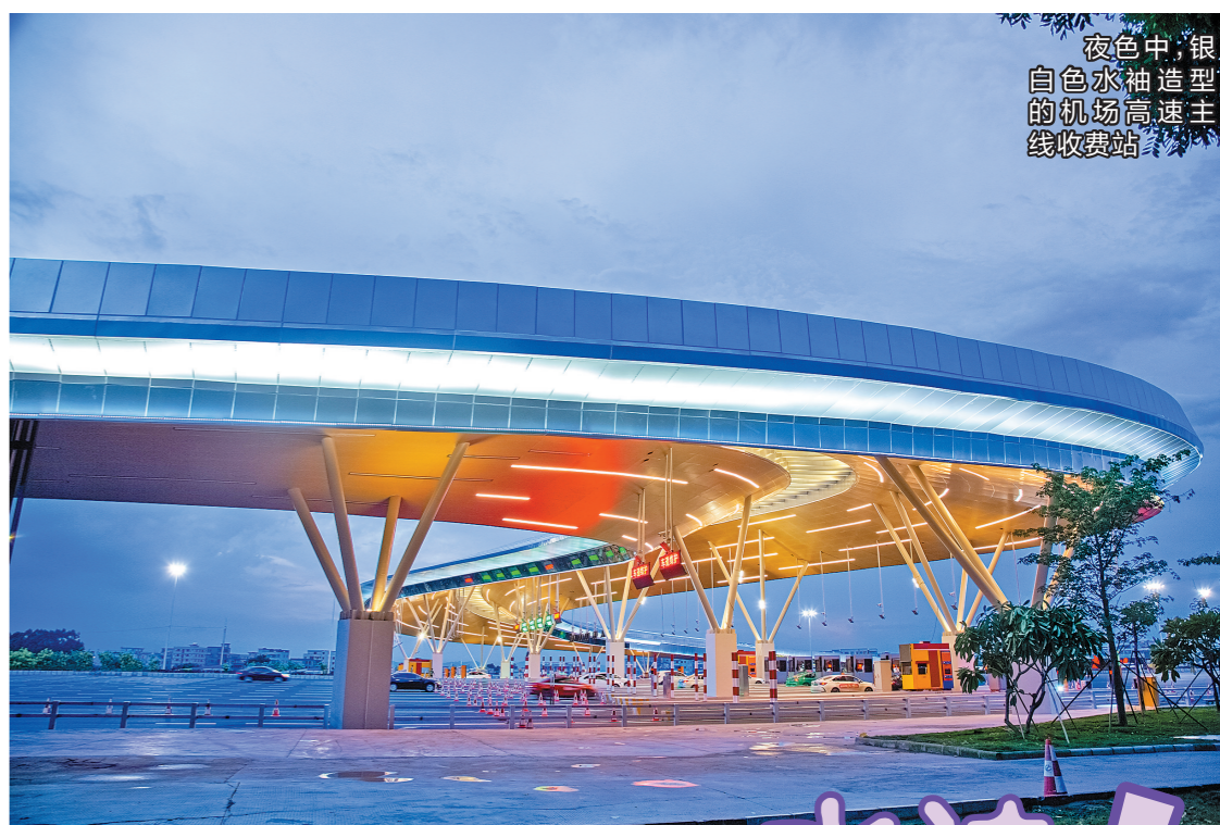
夜色中，银白色水袖造型的机场高速主线收费站

广州还连续举办八届社会组织公益创投活动，通过“福彩公益金+社会资本”资助社会组织开展公益项目，激发社会组织扶弱帮困、参与社会治理的潜能，有效化解基层矛盾，提升社会服务品质。目前已累计资助项目1060个，投入福利彩票公益金1.46亿元。今年，第八届社会组织公益创投活动共有125个社会组织公益项目获得资助，项目涵盖为老服务、青少年服务、扶危济困、社会救助类民生服务等。