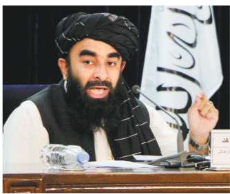
7日，阿富汗塔利班发言人穆贾希德在喀布尔出席记者会