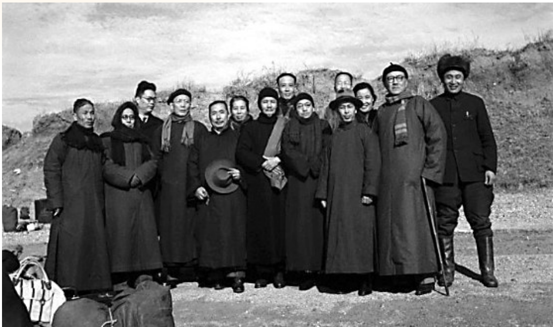
1948年12月3日,第二批由港北上的民主人士乘“华中轮”胜利抵达丹东附近的大王岛,泊船上岸,放下行李,欣喜合影。左起:翦伯赞、马叙伦、宣乡(后)、郭沫若、陈其尤、许广平、冯裕芳、侯外庐(后)、许宝驹、连贯、沈志远(后)、曹孟君(后)、丘哲、安东地区中共领导人

……我们今天熟知的一长串闪光的名字,都曾在此行程之中。 在中国共产党“五一口号”的召集下,他们乔装改扮,舍陆登舟,冒险穿越重重的海陆封锁线,从香港沿大陆海岸线一路北上,去往当时的东北解放区,完成了一次精神、信仰的大迁徙。