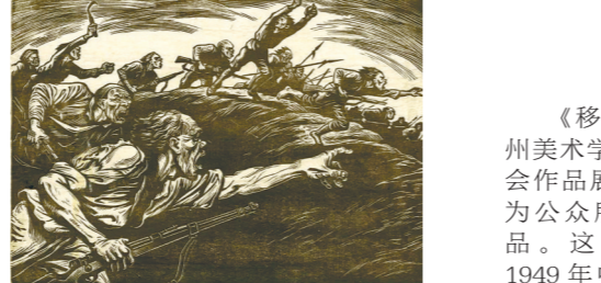
《怒潮组画之一:起来》李桦