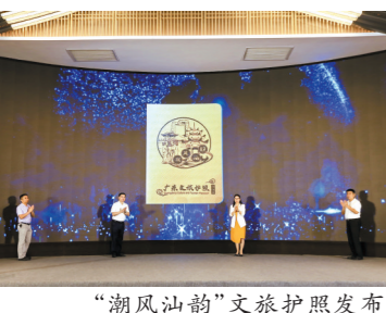
“潮风汕韵”文旅护照发布

品”的趣味互动中,跟着习近平总书记考察足迹,探索潮汕地区精彩纷呈的历史遗迹,体验当地别有风味的美食与美景,感受“古”风情与“潮”文化带来的独特人文魅力。