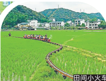
乡村旅游需求大发展快,广东将力争到2025年——