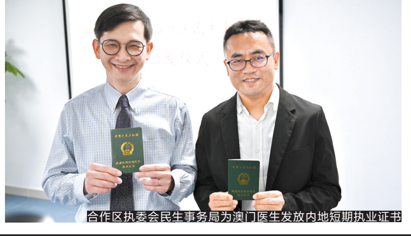
合作区执委会民生事务局为澳门医生发放内地短期执业证书

记者了解到，横琴粤澳深度合作区当日共受理澳门医师内地短期行医核准申请7个，均为珠海市人民医院横琴医院聘用的澳门医师。目前，横琴共引进56名港澳医师在横琴的医疗机构执业，并成功推动澳门医师开设首家内科诊所。