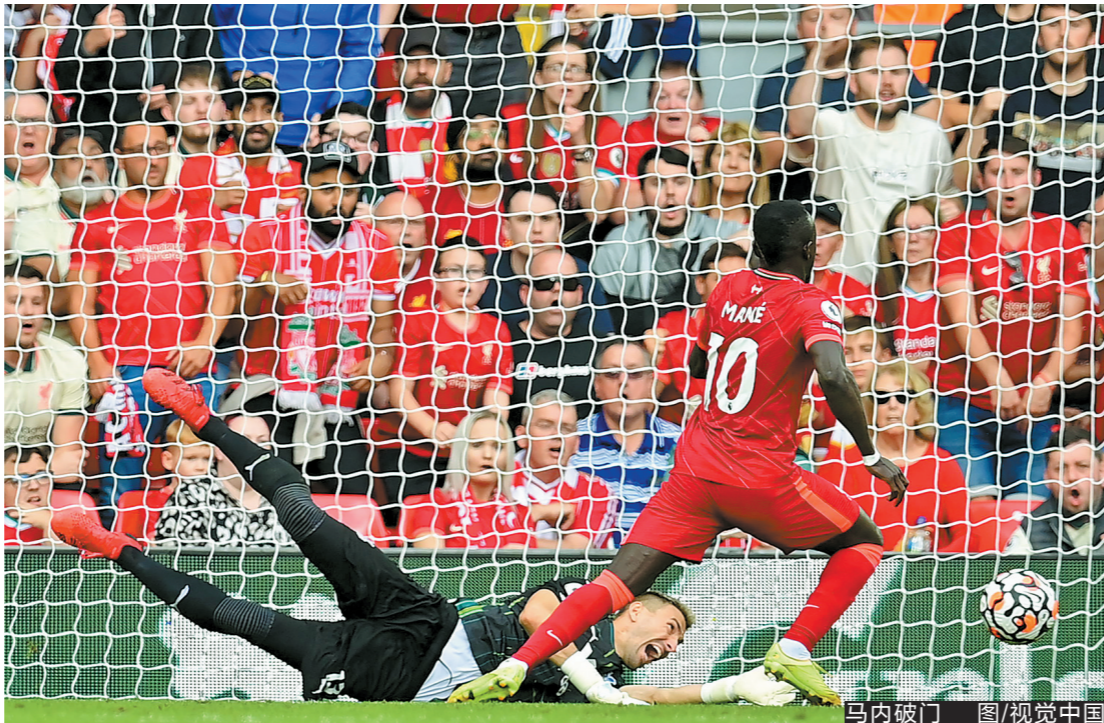
马内破门

利物浦此役的第一个和第三个进球都是角球造成的，近两个赛季他们已经凭借角球射入15球，角球战术成为其重要的得分手段。