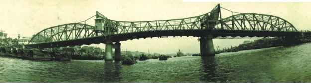
民国时期海珠桥全景