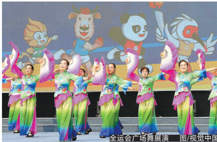
全运会广场舞展演

目决赛外,其余项目的预赛及11个决赛,已通过申办形式在全国各地举办,实现真正的全国总动员。