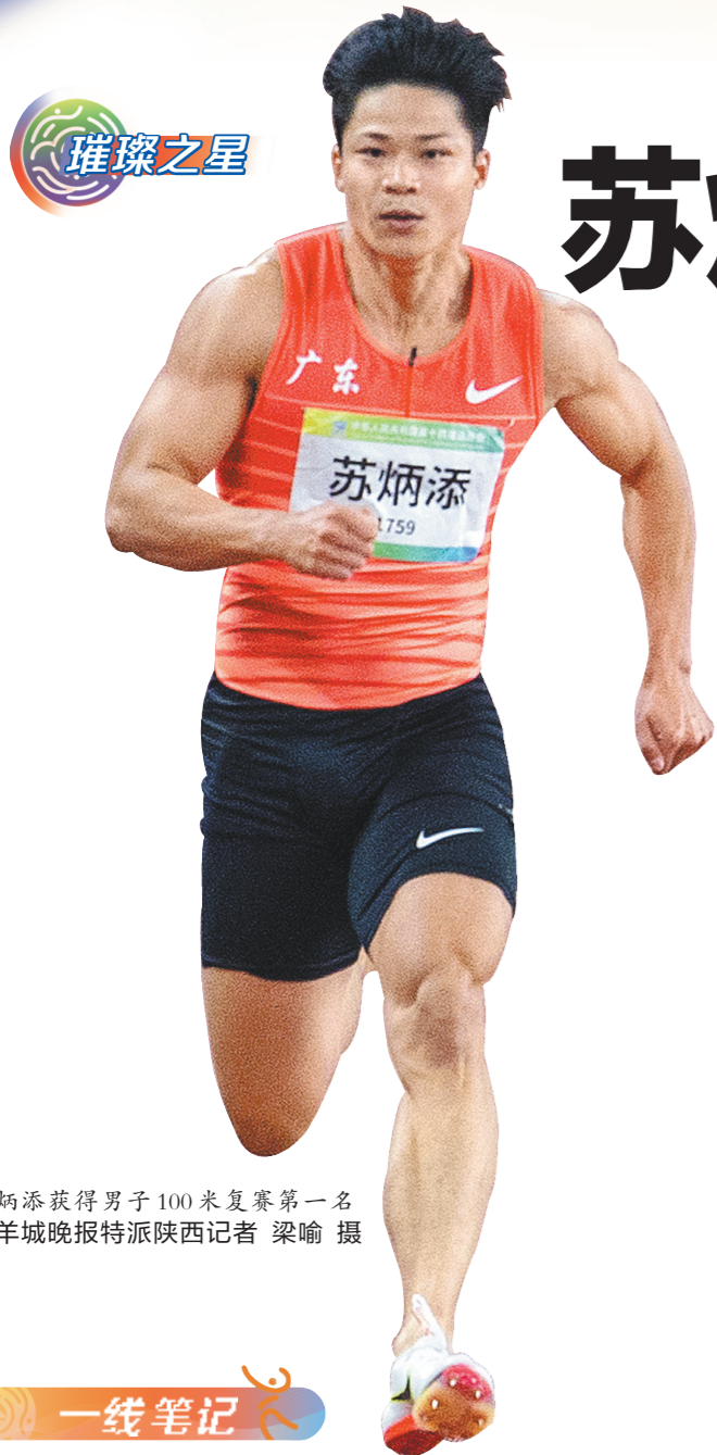
苏炳添获得男子100米复赛第一名