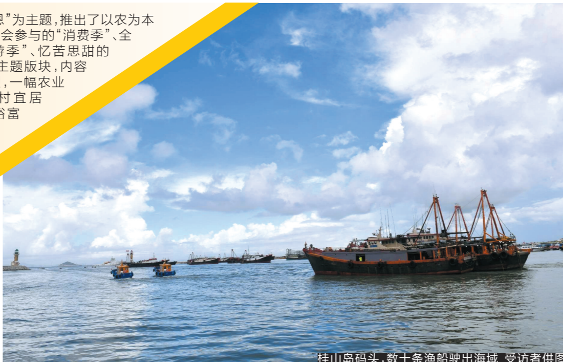
桂山岛码头，数十条渔船驶出海域

“庆丰收 感党恩”为主题，推出了以农为本的“丰收季”、社会参与的“消费季”、全民同乐的“旅游季”、忆苦思甜的“感恩季”四大主题版块，内容丰富，活动热烈，一幅农业高质高效、乡村宜居宜业、农民富裕富足乡村振兴画卷正在珠海展开。