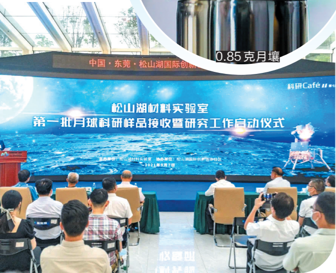
月球科研样品接收暨研究工作启动仪式 资料图

据悉，今年7月12日，国家航天局探月与航天工程中心在北京举行了第一批月球科研样品发放仪式，共计13家单位获得17.4764克月壤样品，标志着嫦娥5号首批月壤样品科学研究工作正式启动。