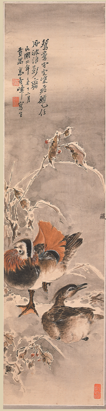
《鸚鵡》高剑强，1932年，中国画，79x20cm，广州艺术博物院藏