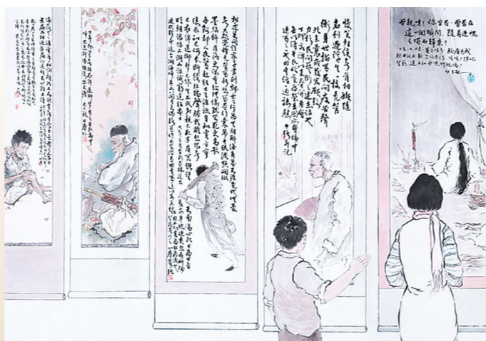
《赏音》黄少强 1931年 135x190cm 中国画 广东美术馆藏