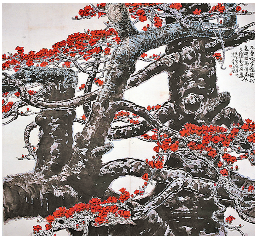
《龙虬》，黄志坚，1982年，中国画，176x192cm