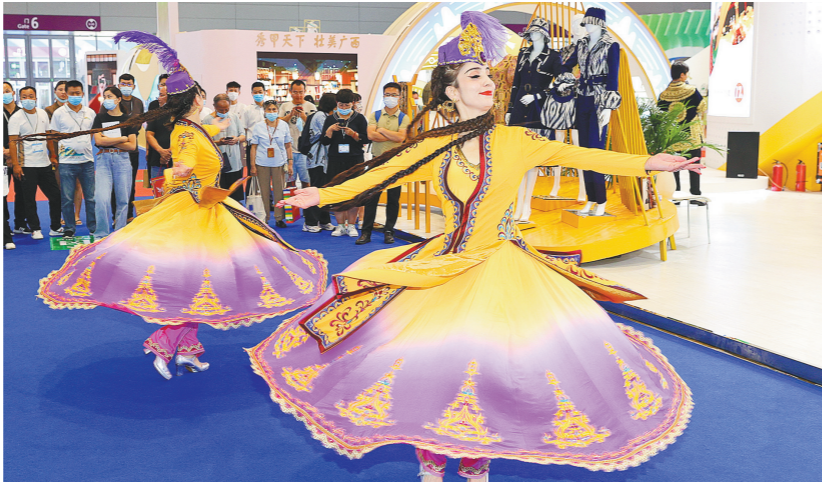
新疆展区为观众带来正宗的新疆歌舞表演