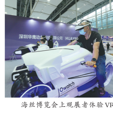
海丝博览会上观展者体验VR