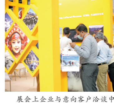
展会上企业与意向客户洽谈中