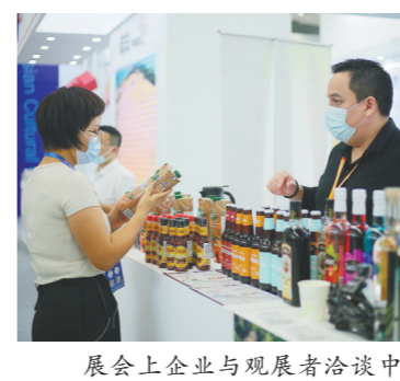
展会上企业与观展者洽谈中

他参展商增进交流，共同开拓广阔的海外市场，向更多“一带一路”国家和地区展现中国的技术力量。