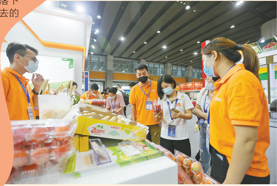
展会企业工作人员介绍产品中