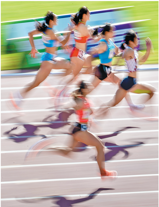
20日,女子100米预赛,运动员们在赛场上风驰电掣