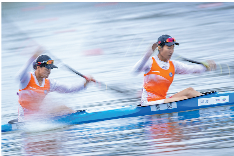
23日,女子500米双人皮艇决赛,湖北队员奋力争胜