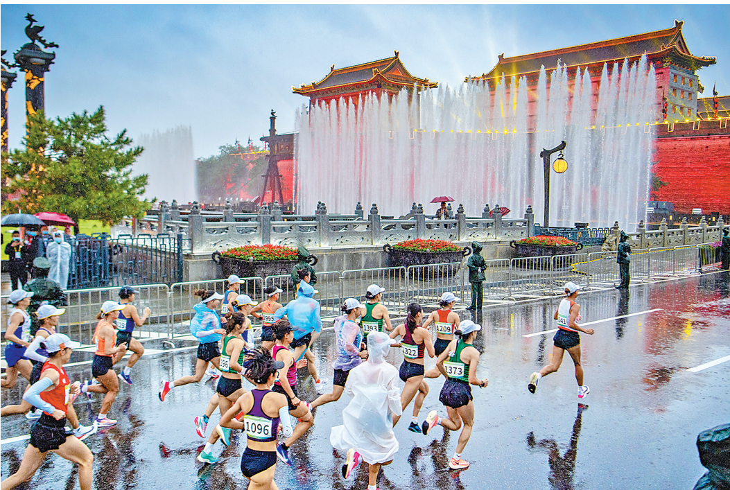
26日上午7时30分,本届运动会田径马拉松项目在西安古城墙永宁门鸣枪开跑,途经钟鼓楼、大雁塔等西安标志性景点