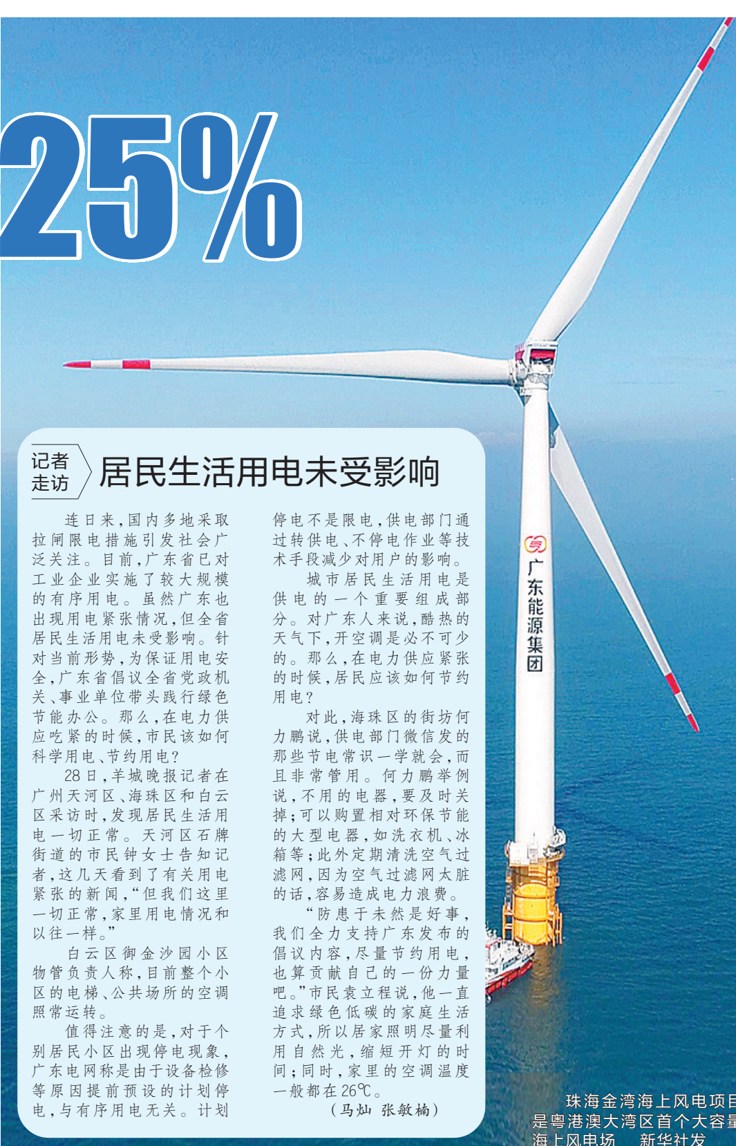
珠海金湾海上风电项目是粤港澳大湾区首个大容量海上风电场

另外,除了节日期间,深圳日常的景观以及路灯照明也会进行适当调整。比如,深圳市的行道树照明将全部关停;桥梁原来是每天都亮灯的,现在改为周五周六亮灯。在具备条件的路灯,如双光源的灯具上,在下半夜关停另一盏光源,起到节能的作用。