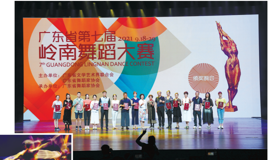
与会领导嘉宾为参赛作品的优胜者颁奖

本届大赛沿用网络直播的方式，得到大众的广泛关注。统计数据显示，截至9月29日12时，共有142万人次通过网络直播观看了比赛。