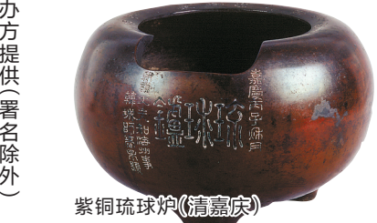
紫铜琉球炉(清嘉庆)