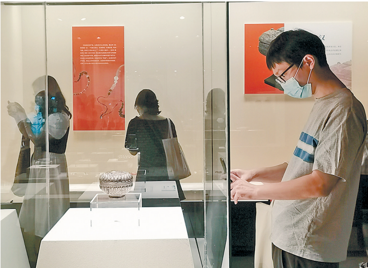
展览现场

南京，古称金陵、建康，地处中国东部、长江下游，濒江近海。六朝时期，东吴建成了以建康(南京)为起点的东海航线，使之与南海航线联为一体，东亚、东南亚、西亚等国家和地区众多的使节、僧侣在此交流往来。明初推行睦邻友好的和平外交政策，明朝诸帝在南京皇宫中接待过逾百次经海上丝绸之路来朝贡贸易的外国使臣。明永乐三年(1405年)，南京成为“郑和下西洋”航海壮举的始发港。南京地区的龙江船厂遗址、净觉宫王墓、郑和墓、洪保墓等遗迹，正是这段历史的见证。