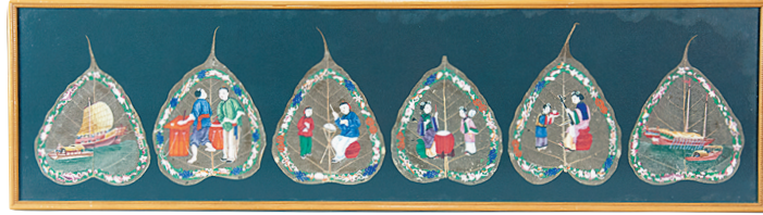
水彩船舶人物菩提叶画(十九世纪后期)

乾隆二十二年(1757年)，仅保留广州口岸一关，并特许广州十三行商统一经营全国对外贸易，在西关的珠江河北岸设立夷馆，规定为外商办理商务及居留之地。十三行涌现出伍、潘、卢、叶等四大家族为首的豪商巨富。