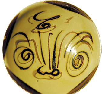
长沙窑青釉褐斑褐绿彩阿拉伯文碗(唐)