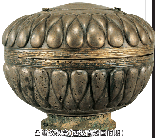
凸瓣纹银盒(西汉南越国时期)

广州，古称番禺，位处珠江入海口，南临大海，北接中原。自公元前203年赵佗建立南越国，定都番禺(今广州)始，这里一直是“海丝”的重要节点，2000余年见证了广州伴随海上丝绸之路演进历程持续繁荣的历史。南越国官署遗址、南越文王墓、光孝寺、南海神庙及明清码头、怀圣寺光塔和清真先贤古墓等史迹，以及大量的出土文物和丰富的历史文献，实证广州自秦汉以来持续不断的海外交往，见证了中西方文明在这座港市的交流融合。