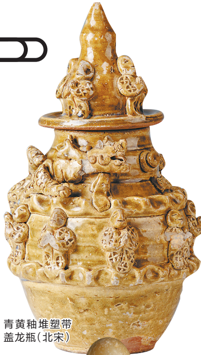
青黄釉堆塑带盖龙瓶(北宋)