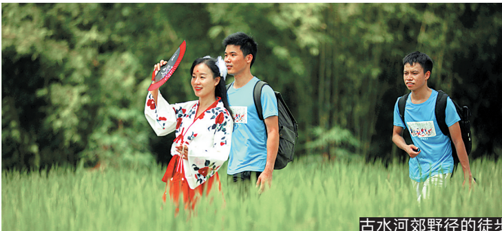
古水河郊野径的徒步

专家认为,在农文旅融合的大背景下,更多高质量乡村旅游产品不断涌现,广东乡村旅游还会继续火下去,到2025年,全省休闲农业与乡村旅游接待人数甚至有望突破1.8亿人次。