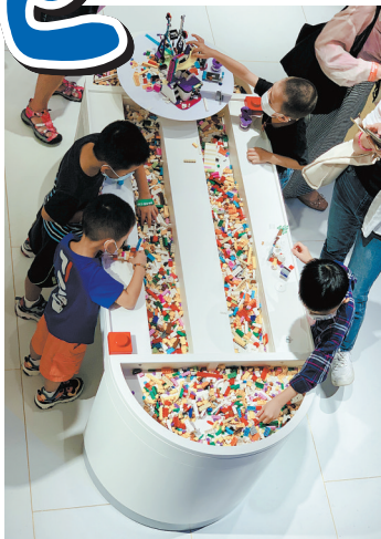
亲子游成为“双减”后最亮眼的一大板块

在赖竞峰看来,回到乡下,去体验和大自然频率一致的场景和生活,未来将被越来越多人所接受,成为长假旅行度假的首选。