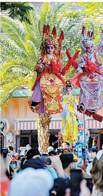
鼎龙湾非遗文化展,将吴川飘色、南派粤剧等传统文化融入滨海旅游