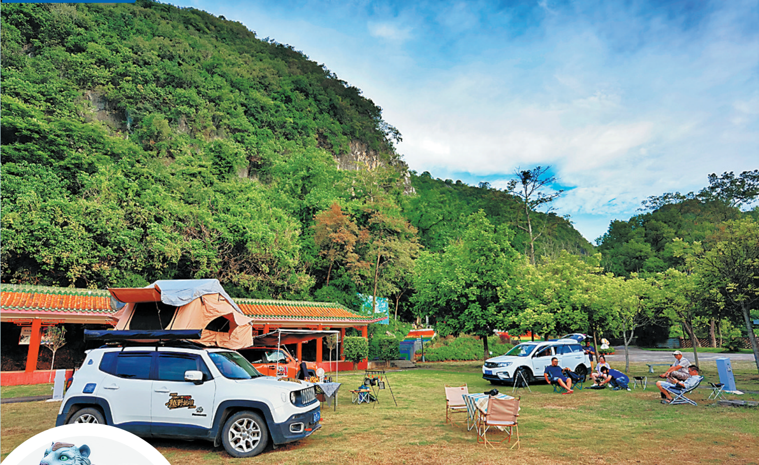
封开龙山 景区今年国庆 假期人气激增