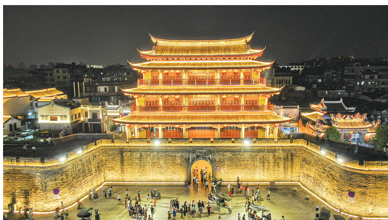
全国各地不少游客慕名到潮州广济楼打卡

目前，广东全省拥有世界文化遗产1处，全国重点文物保护单位131处，省级文物保护单位755处；核定公布不可移动文物2.5万余处，国有可移动文物875254件（套），国有珍贵文物达79010件（套）；现有国家级非物质文化遗产代表性传承人132人，省级非物质文化遗产代表性传承人837人。