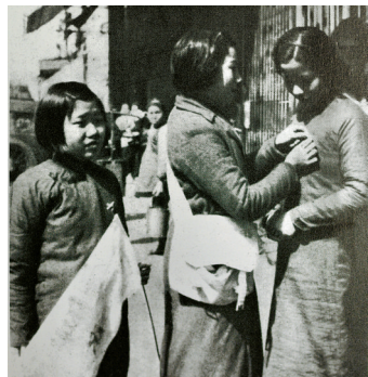
广州妇女联合会在街头募捐,劝购纪念章

这天晚上,广州“文抗会”还照常开着纪念鲁迅逝世两周年的会议。第二天(20日),增城失守。夏衍在向当时的国民党第四战区动员委员会秘书长钟天心、广东省党部书记长谌小岑等求证这一消息时,钟天心还坚决予以否认,他说:“这是不会有的事情。”坊间不少人都把日军即将入侵的消息,当作是“谣言”。