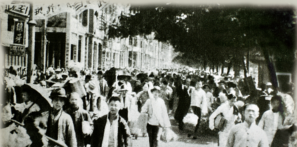
广州沦陷前夕,许多市民惊慌撤离广州