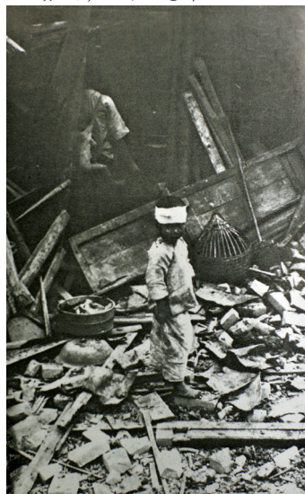
广州遭空袭后无家可归的孩子

口如瓶地不发表一点消息,而一切公用机关,邮政、电报、银行,都已经自动地停止工作了,整个广州像被抛弃了的婴儿似的,再也没有人出来过问。“保卫大广州”的口号也悄悄地从那些忙着搬家眷的人们嘴里咽下去了。