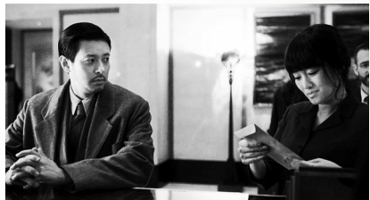
《兰心大剧院》营造出一种氤氲潮湿的氛围

比时间上的模糊更耐人寻味的,则是《兰心大剧院》在空间乃至人物关系上的去边界化。《星期六小说》是一部即将在兰心大剧院公演的话剧,这意味着整个舞台顶多只有三面布景,还有一面必须留给观众视野。但随着影片镜头跟随人物流转,你渐渐会忘记这本应该是一个舞台,若你留