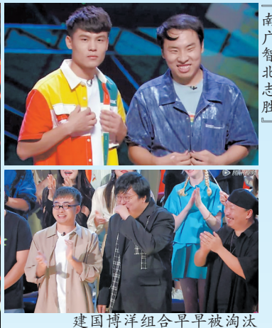
「南广智北志胜」建国博洋组合早早被淘汰