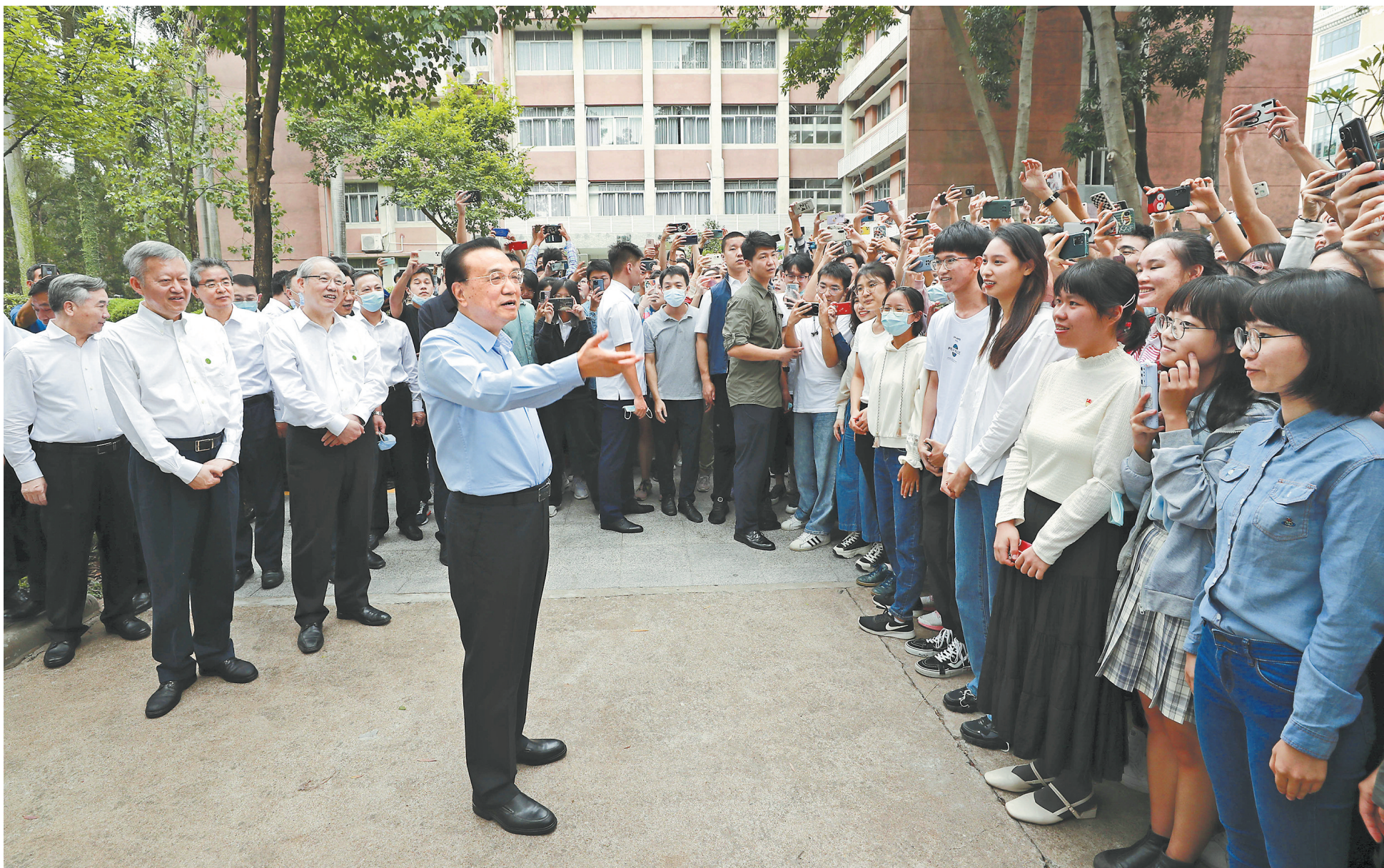
10月13日至15日,在出席第130届广交会期间,李克强在佛山、广州考察。这是10月15日,李克强在中山大学与师生交流