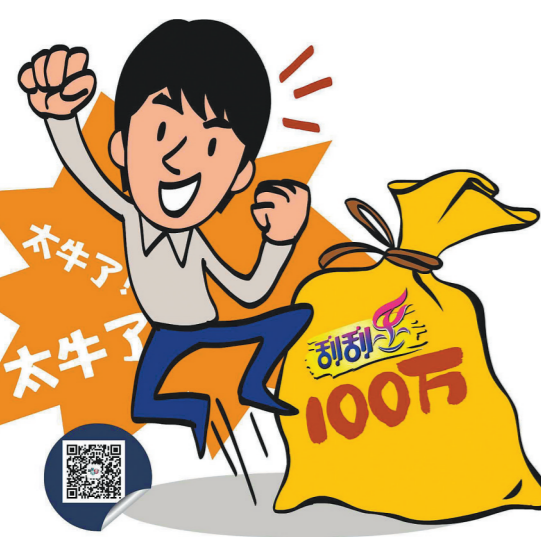
羊城晚报记者 张爱丽 通讯员 郭新庆 插图 采采

“哇噻,太牛了,100万元!”国庆节期间,位于广州超级文和友美食商场的44012999网红福彩站爆出热烈的欢呼声,一位00后小伙在这里刮出了福彩刮刮乐“金满堂”一等奖100万元,这也是该站开业一年以来中出的首个百万大奖。近日,中奖者小刀在朋友的陪同下来到市福彩中心办理了兑奖手续。