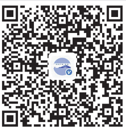
扫码聆听上期《岁月中的豆腐》粤语播音

记得我最近一次吃糗饭，是在读高中的时候。一天家中父母工作没回，煮饭落到奶奶身上。奶奶不会用电饭锅，仍用铁锅煮饭，煮好便篱成糗饭，倒是无心插柳地让我们重新体验了一把儿时一饭两吃的快乐。