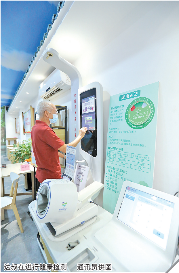
达叔在进行健康检测

据了解,越秀区在旧南海县试点创新智慧社区合作新模式,由“政府+企业”联合建设运营,将政府、运营商、服务商三方角色进行资源整合、平台互通、数据共享,推动社区居家养老可持续发展。(羊城晚报记者 郭思琦)