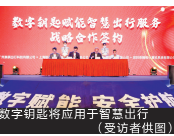
数字钥匙赋能智慧出行服务 战略合作签约

羊城晚报讯 记者詹翔羽、全良波、通讯员陈瑞锋、李孔青报道:21日,2021年阳江市重大项目集中开工江城区现场会在阳江市张江小泉智能制造有限公司召开,持续掀起阳江大招商、大建设、大发展新热潮。据悉,集中开工、竣工和签约的重大项目共83个,总投资320.6亿元,涵盖了装备制造、金属制品、食品加工、服装鞋帽、硅胶制品、环保电镀等行业。