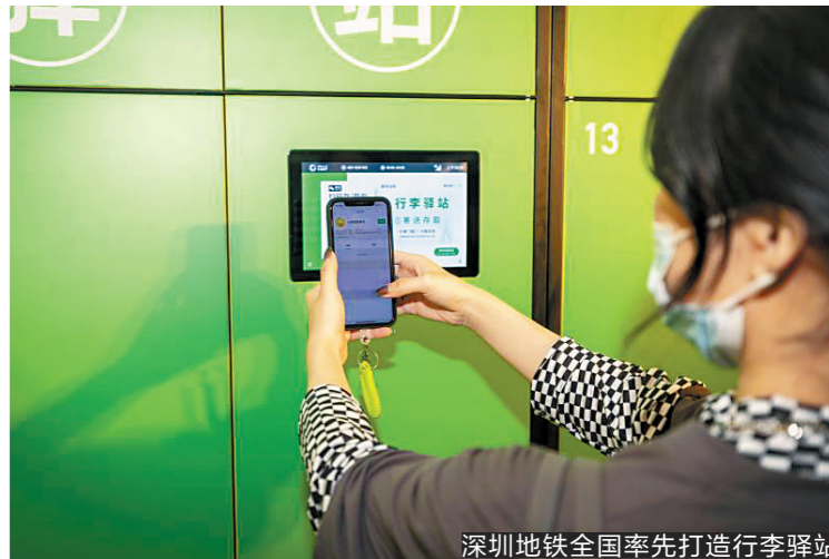
深圳地铁全国率先打造行李驿站

羊城晚报讯 记者李天军摄影报道:21日,深圳地铁集团在全国率先试行“地铁行李驿站”服务。据了解,该服务是全国首个航空-地铁创新联运项目,同时也是深圳地铁首次试水高峰时段货运物流服务。