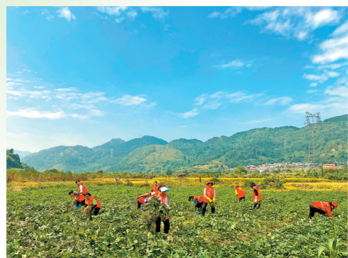
志愿者帮薯农采收番薯

记者近日在乳源县乳城镇岭溪村、大布镇英明村等地走访时发现,当地志愿者们或在田间帮薯农采收番薯,或在地头通过网络直播推销番薯,到处一派繁忙。大布圩镇的番薯加工厂里,新机器设备也全速运转起来,工人们正忙着为珠三角等地涌来的大量订单备货。