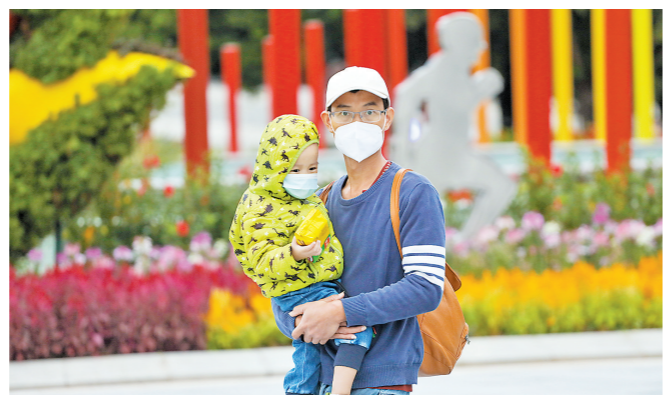
昨日，广州花城广场，大人怀抱厚厚的小朋友出门

根据广州市气候与农业气象中心22日发布的《广州秋收秋种气象服务(2021年第1期)》，过去一周(10月15日~10月21日)广州平均气温23℃，较近十年同期偏低1.3℃；平均累计日照时数30.1小时，较近十年同期偏少31.3%。这样的天气，给广州地区的秋收秋种带来不利影响。广州市气候与农业气象中心预计，随着10月24日起广州转多云天气为主，未来一周广州大部分时段天气条件有利于开展秋收秋种工作，建议农业从业人员抓紧时机进行秋收秋种。因为根据目前的气象资料预报，在经过一段相对平稳的天气后，广州有可能因为冷空气的到访天气再度变得不稳定。预计11月1日至11月21日期间，广州将有三次主要冷空气影响过程。