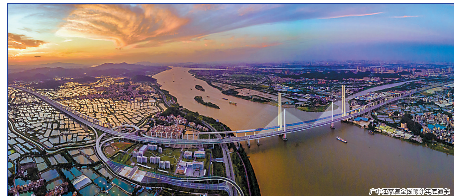
广中江高速全线预计年底通车

早稻丰收，晚稻也长势良好。8-9月广东大部地区晴雨相间，全省各地出现明显降水，缓解了6-7月轻旱旱情，使晚稻移栽顺利进行。据基点县监测数据，目前大部分地区