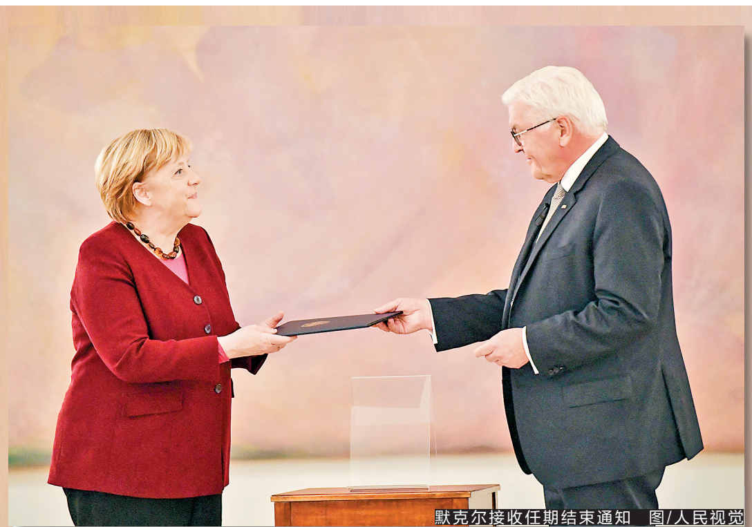
默克尔接收任期结束通知

布尔汉说，新组建的政府“将是完全非军方的政府，由这个国家有能力的人组成，绝不会包含偏心和政界人士”，一旦组建完成，国家紧急状态就会取消。（新华社）