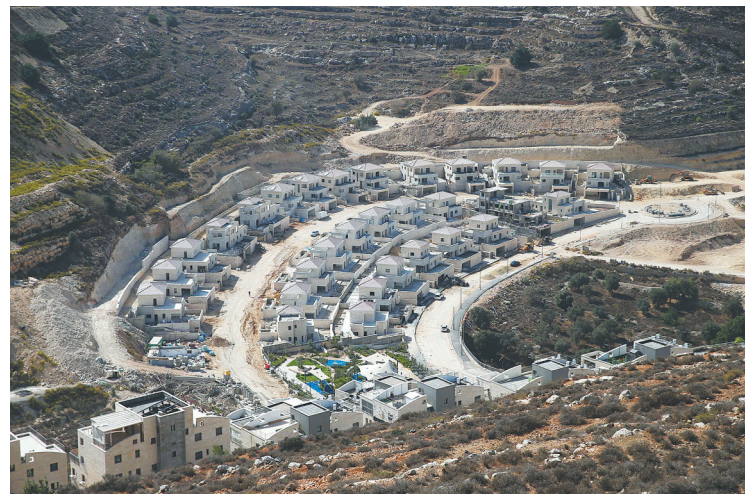
约旦河西岸的犹太人定居点吉瓦特泽夫的房屋