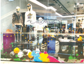
橱窗里的秋装已是琳琅满目

系列单品，我认为会是这两年的流行趋势。” “以我们的经验来看，其实秋装一般在7月末8月初就开始上市了，初秋的产品不会太厚，适销期也是蛮长的。”emoduse+品牌相关负责人对记者说，“一般来说秋装在深秋波段的产品会相对厚一些，上市的话也会是先上北方市场，南方的店铺会晚一到两周，10月份我们的冬装也已经上市了，这段时间广州、广东的降温对我们南方市场的销售肯定是有好处的，气温下降也会让消费者提前做出购买决定。”该负责人表示，一般来说，时装的销售旺季集中在秋冬波段，秋冬的气温会影响需求，消费者穿搭的需求会比春夏季普遍高一些。 除了琳琅满目的秋装新品，也有商圈组织开展了丰富多彩的时尚活动。广州友谊商店近日便在环市东广场举办了第五届国际时尚节。据介绍，这是一次“大牌云集、新品争艳”、演绎2021秋冬最新国际服饰潮流的时尚节，期间，包含众多国际知名品牌商品在内的各式潮流服饰在环市东广场的秀场上亮相，诠释2021秋冬时尚服饰的魅力。 广州友谊商店相关负责人表示，对记者表示，天气骤然降温，也激发了市民换季购买服装的热情。秋冬新品热卖、厚装、保暖服饰动销活跃。友谊商店秋冬服饰新品上架率超90%，在充足的货源支持下，吸引品牌粉丝抢先入柜抢购，秋冬新品的销售占比9成以上，卫衣、长袖T恤、长裤、羊绒外套等动销活跃。此外，内衣保暖类商品、童装类的销售也因这一波的冷空气带旺不少。床品、毛巾类因受冷空气影响，秋冬厚被、特惠套装热销，主力品牌增长，总体销售同比升幅近40%。