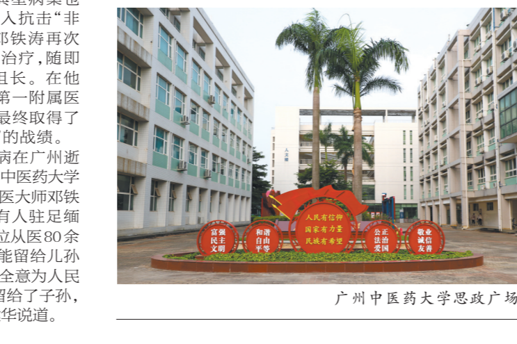
广州中医药大学邓铁涛教授文展展

给中央请求振兴中医，又两次联合全国老中医“八老上书”，推动中医事业持续发展。“振兴中医，需要一大批真才实学的青年中医作为先锋。”这是邓铁涛写给广州中医药大学学生的信，也是他的肺腑之言。 邓铁涛一生治愈过无数患者。SARS刚暴发时，医学界还未研究出对付SARS的方案，当时87岁高龄的邓铁涛认为中医能治疗非典，并撰写了中医防治SARS的文章，把诊治的典型病案也附在后面，以便全国中医介入抗击“非典”时参考。2003年2月，邓铁涛再次上书，请求中医介入“非典”治疗，随即他临危受命任中医专家组组长。在他的努力下，广州中医药大学第一附属医院共救治73例SARS病人，最终取得了“零转院”“零死亡”“零感染”的战绩。 2019年，邓铁涛教授因病在广州逝世，享年104岁。如今，在广州中医药大学第一附属医院门诊楼门口，国医大师邓铁涛的汉白玉雕塑前，总是有人驻足缅怀。无数中医人难以忘怀，这位从医80余载的老人在遗嘱中写道：“我能留给子孙最大的遗产为仁心仁术，全心全意为人民服务。”“这一宝贵遗产，不仅留给了子孙，也留给了所有广中医人。”张建华说道。