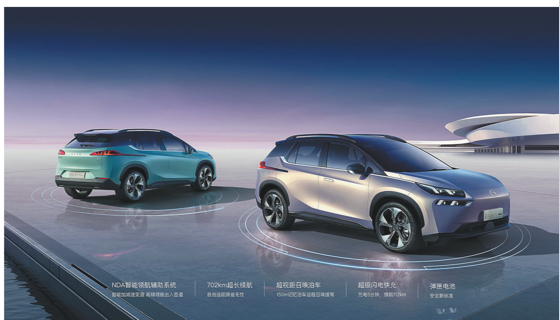
广汽埃安AION V Plus

广汽埃安还自主研发弹匣电池系统安全技术，在行业首次实现了三元锂电池整包针刺不起火。“10万级科技头等舱”AION Y成为首款搭载弹匣电池技术的车型。随着ADIGO智驾互联生态系统进化至4.0版本，AION V Plus拥有了行业顶尖的超视距召唤泊车。它不仅支持地库及地面停车场，还支持场外非划线停车位，手机操作远程无人代客泊车和召唤接驾。此外，广汽埃安还是全球首个实现可定制生产的，目前广汽埃安APP上已有逾6万种定制组合选择。