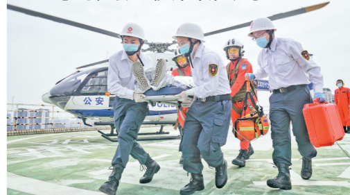
“伤员”被转运至医院

羊城晚报讯 记者林清清，实习生许留通，通讯员胡颖仪、孙冰倩报道：莞深高速增城区河洞服务区入口端匝道路段，突发重大交通事故。多车连环相撞，多名人员受伤，甚至有重度烧伤伤员，病情危急！此时一架H145直升机出现，仅用不到半小时，就将增城现场伤员安全转运至位于海珠区的广州市红十字会医院8号楼楼顶停机坪，多名“伤者”“无缝衔接”立即转入烧伤手术室开展手术……不用慌，以上场景是一次应急演练。28日，广州开展2021年高速公路较大交通事故航空紧急医学救援联合演练。本次演练首次采取警医等多部门、多专业间的联合协同作战。