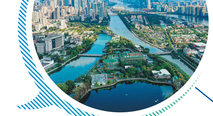
越秀着力打造“湾区创新枢纽、都会产业高地、美好生活样板” 通讯员供图