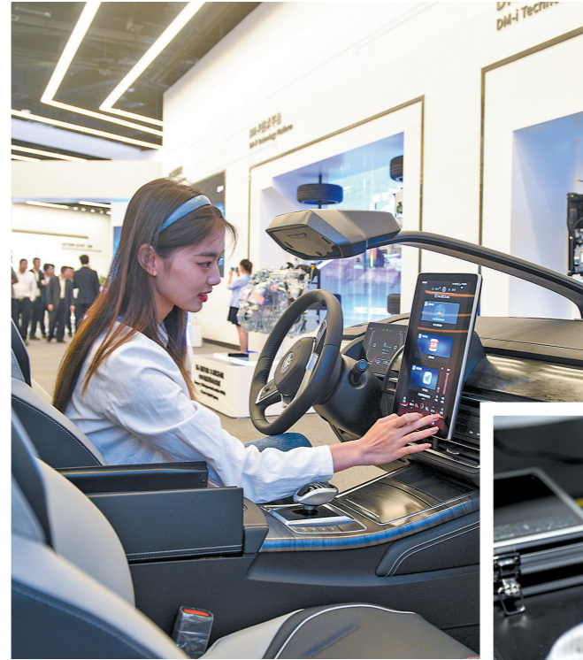
广东加速打造汽车“智造”产业集群 羊城晚报记者 宋金峪 摄