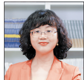
邵燕君 北京大学中文系教授