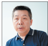
马季 中国作协网络文学研究院研究员