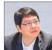
夏烈 杭州师范大学文化创意与传媒学院教授、中国作协网络文学研究院副院长