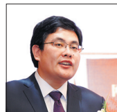
刘英 网大公开课导师、中国文艺评论家协会会员