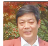
欧阳友权 安徽大学大师讲席教授、中南大学文学院教授