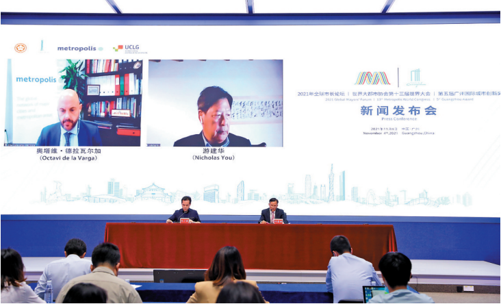
新闻发布会现场

11月4日,广州市人民政府新闻办公室召开2021年全球市长论坛暨世界大都市协会第十三届世界大会及第五届广州国际城市创新奖(下称“2021年全球市长论坛系列活动”)新闻发布会。记者从会上获悉,2021年全球市长论坛系列活动将于11月8日至13日以线上线下融合方式举行。届时,第五届广州国际城市创新奖(简称“广州奖”)将在全球15个入围城市中评选出5个获奖城市;近600名中外嘉宾将参加活动,共话城市治理。