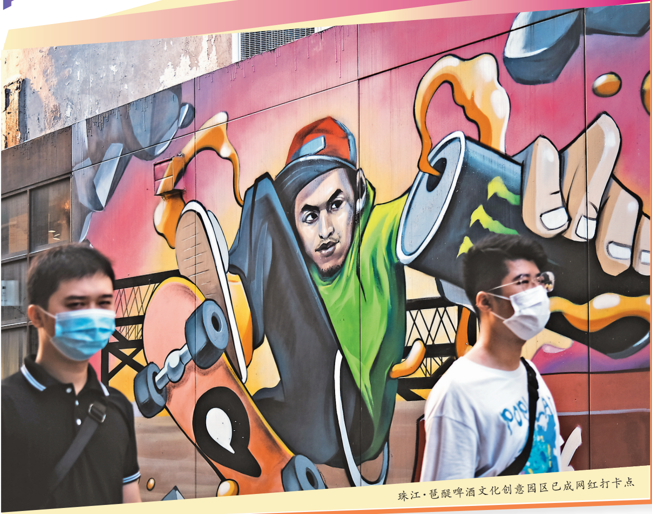
珠江·琶醍啤酒文化创意园已成网红打卡点