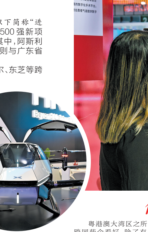
来自广东的小鹏汽车备受关注

11月5日,第四届进博会暨虹桥国际经济论坛以线下线上结合方式,举行了多场平行分论坛。在“智启新时代:智能科技与产业合作”分论坛上,与会嘉宾认为,智能科技赋能将迸发出强大的创新潜力,助推构建智能价值链的全球新生态。 继在去年进博会上宣布将于广州建设阿斯利康中国南部总部之后,今年进博会上,阿斯利康宣布,将与广州国际生物岛公司共建创新园,助力生物岛加快创建世界顶尖的生物医药和生物安全研发中心。该园区将引入阿斯利康整体管理模式及专家团队,吸引以精准诊断为核心的上下游优质企业,填补产业空白。 “去年,阿斯利康选择在广州设立南部总部,对进一步做大做强华南市场有着重要的战略意义。”阿斯利康中国肿瘤业务部总经理殷敬敏表示,接下来将聚焦肿瘤领域和慢病领域开