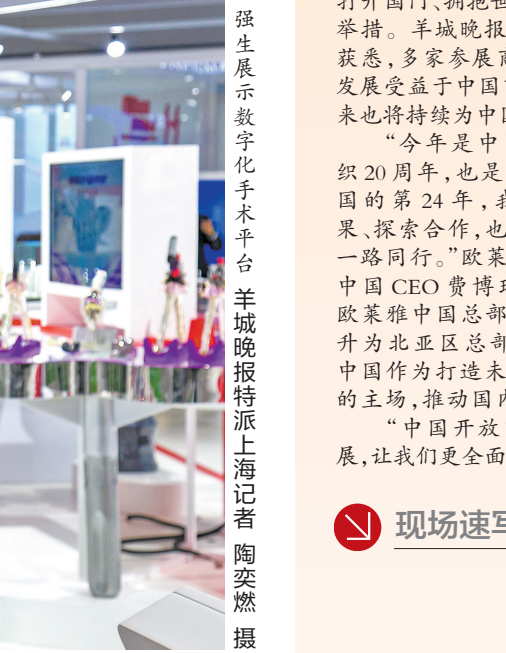
强生展示数字化手术平台