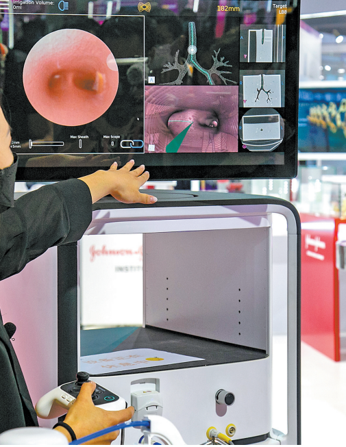
强生展示数字化手术平台

展生物医药研发及精准诊断,助力广州加速打造生物医药产业高地。 与阿斯利康一样,美国强生也对大湾区市场信心满满。据介绍,此次与广东省达成战略合作,强生将争取在大湾区打造创新医疗药械产、学、研、用一体化发展的典范。“我们将加大对强生广州生产基地和研发中心的投入,推动升级改造。”强生相关负责人介绍,接下来,强生将在大湾区主推眼科和精神卫生项目,助力粤港澳大湾区建设成为具有全球影响力的国际科技创新中心。