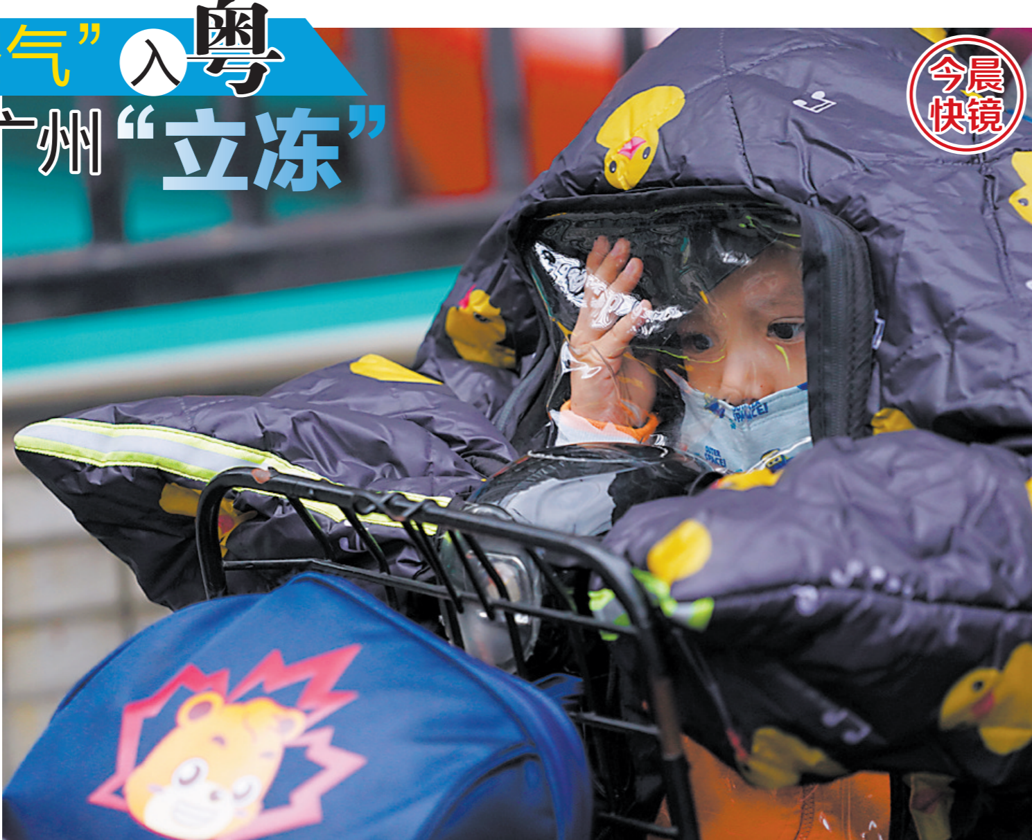
8日，冷空气抵粤后，广州大幅降温。图为今晨的广州海珠区滨江街道，市民纷纷添加衣物出行

根据中央气象台11月8日早晨的预计，8日8时至9日8时，广东、广西东部等地部分地区降温幅度可达8-10℃，局地12℃以上，并伴有5-7级偏北风、阵风8-10级。根据广州市气象台8日的会商预报结论，广州市区有望在“双十一”当天最高气温突破“2字头”回升至20℃，至14日升至22℃，最低气温从9日至12日均维持在11℃，至14日也仅升至13℃。