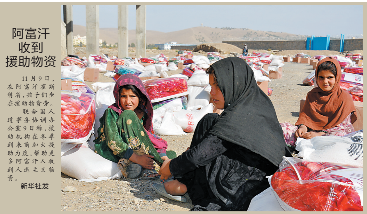
阿富汗收到援助物资。11月9日，在阿富汗霍斯特省，孩子们坐在援助物资旁。联合国人道事务协调办公室9日称，援助机构在冬季到来前加大援助力度，帮助更多阿富汗人收到人道主义物资。

据新华社电 阿富汗塔利班发言人10日表示，近三个月以来，阿富汗临时政府已逮捕600名极端组织“伊斯兰国”武装分子。塔利班发言人穆贾希德当天在记者会上说，近三个月以来，塔利班捣毁了“伊斯兰国”在喀布尔省、楠格哈尔省和赫拉特省等地的21处据点，逮捕了该组织600名武装分子。他表示，“伊斯兰国”没有得到阿富汗民众的支持，塔利班将继续打击该组织。穆贾希德同时强调，塔利班不允许任何组织利用阿富汗领土策划国际安全。塔利班8月15日接管阿富汗政权以来，“伊斯兰国”阿富汗分支在阿多地发动袭击。10月8日，昆都士省首府昆都士市一座清真寺遭爆炸袭击，超过50人死亡、百余人受伤；10月15日，坎大哈省首府坎大哈市一座清真寺遭爆炸袭击，至少47人死亡、90多人受伤；10月21日，喀布尔西北部一座输电塔遭爆炸袭击，导致喀布尔及周边地区电力供应一度中断。