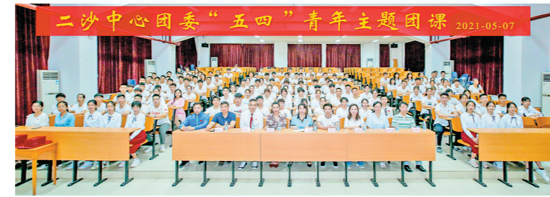
二沙中心团委“五四”青年主题团课