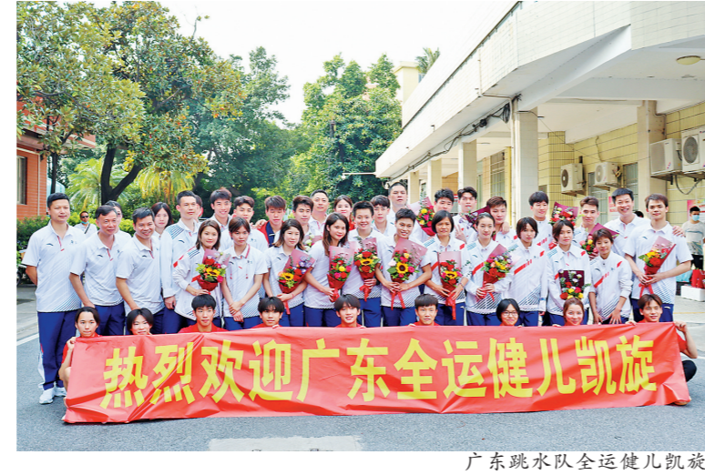
广东跳水队全运健儿凯旋