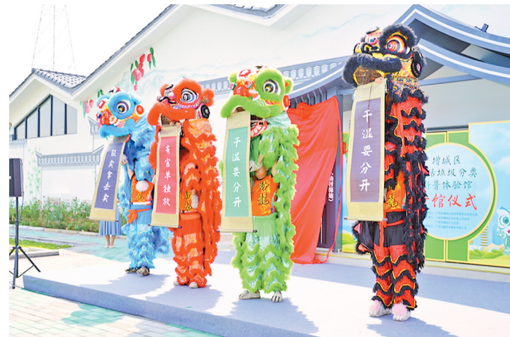
广州垃圾分类“四小萌宠”表演

羊城晚报讯 记者梁悛韬,通讯员成广聚、吴锦锋报道:继5月19日广州公布今年第一季度全市各区、街(镇)生活垃圾分类排名后,时隔半年全市生活垃圾分类排名再放榜!11月11日晚,广州市城管部门向社会公布第二、三季度全市各区、街(镇)生活垃圾分类排名。