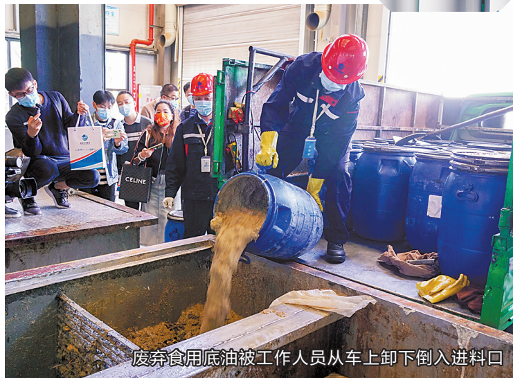
废弃食用底油被工作人员从车上卸下倒入进料口

值得一提的是,生物柴油源于生物质可再生清洁能源,对环境十分友好。另外两种副产品同样有其价值,甘油可用于化妆品生产,植物沥青则是铸造黏结剂的主要原料之一。根据广州东部生物物质综合处理厂目前的处理能力,废弃食用油脂入厂后只需8-12小时“精加工”,便可被制为生物柴油。