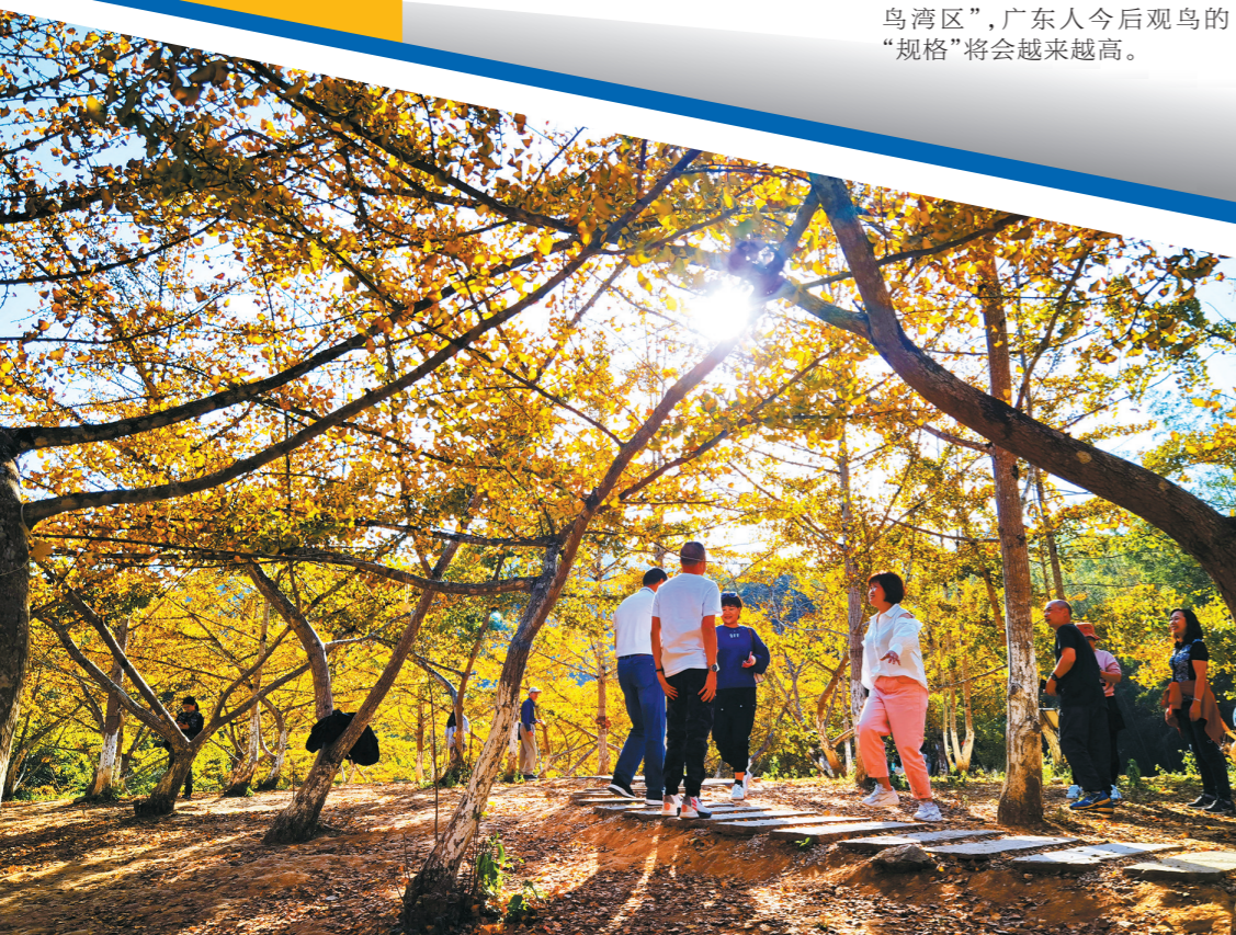
南雄坪田银杏