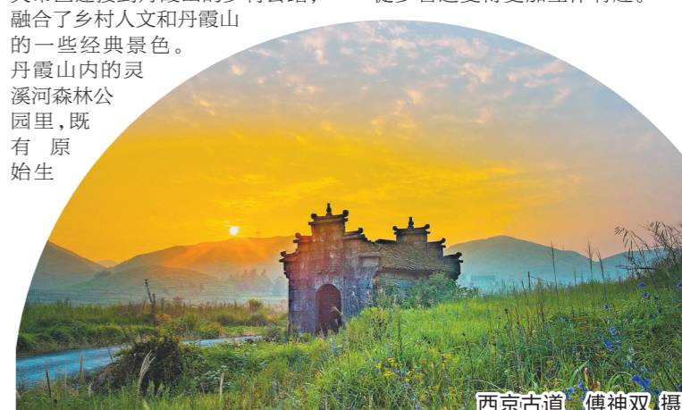
西京古道

据悉，肇庆四会市也亮相了一段全长25公里的古邑碧道画廊精品线路，沿途有橄榄村、扶利古法造纸村、梅兰竹桂田园综合体、渔港湾湿地公园等景点，串联起当地的红色文化、造纸文化、兰花文化等多种文化深度体验，让徒步碧道变得更加立体有趣。