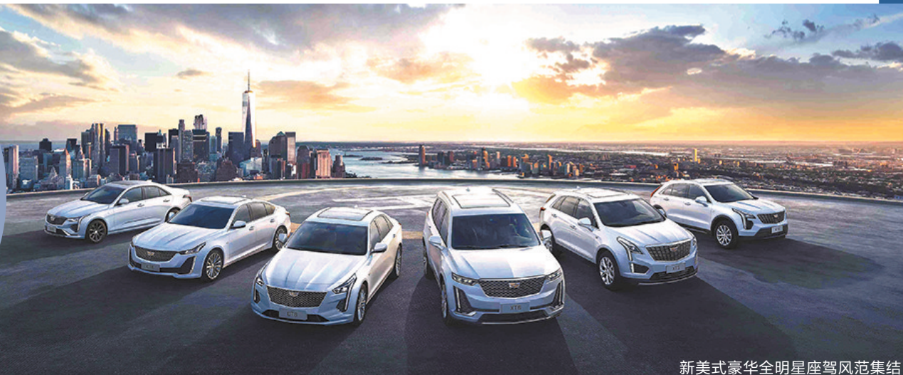
新美式豪华全明星座驾风范集结

11月19日,2021年汽车行业年终盛会——第十九届广州国际汽车展览会将在琶洲展馆拉开大幕。上汽通用汽车在本届广州车展放出大招,旗下别克、雪佛兰和凯迪拉克三大品牌42款展车组成豪华阵容亮相广州车展!展车中不仅有首次显露真身的凯迪拉克原生豪华纯电中大型SUV LYRIQ量产版,还有全球首发的别克GL8旗舰概念车与别克Smart Pod智慧驾舱。而雪佛兰开拓者“白夜版”惊艳亮相,将领衔一众传奇经典车型鲜活展现百年品牌的生生不息。