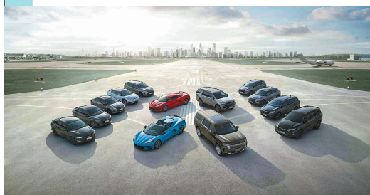
雪佛兰将携旗下重磅产品亮相