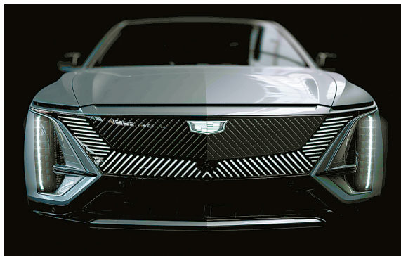
凯迪拉克原生豪华纯电中大型SUV LYRIQ

高科技感在凯迪拉克的展台上表露无遗。巨型“裸眼3D”的动态艺术展示墙配合技术解析装置,可视化地诠释奥特能电动车平台的强大实力;凯迪拉克还创新展示了LYRIQ所搭载的环幕式超视网膜屏,让观众在现场体验可媲美专业显示器的9K分辨率色彩效果。此外,展台还融入了具有粤式风情的“凯记冰室”岭南特色美食体验区,以及备受喜爱的凯迪拉克盲盒机,为消费者带来别具一格的沉浸式体验。