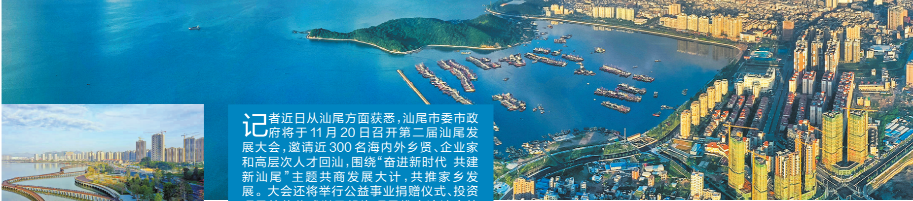
汕尾美丽的城乡面貌

记者近日从汕尾方面获悉，汕尾市委市政府将于11月20日召开第二届汕尾发展大会，邀请近300名海内外乡贤、企业家和高层次人才回汕，围绕“奋进新时代 共建新汕尾”主题共商发展大计，共推家乡发展。大会还将举行公益事业捐赠仪式、投资项目签约仪式以及投资项目推介洽谈会等活动。