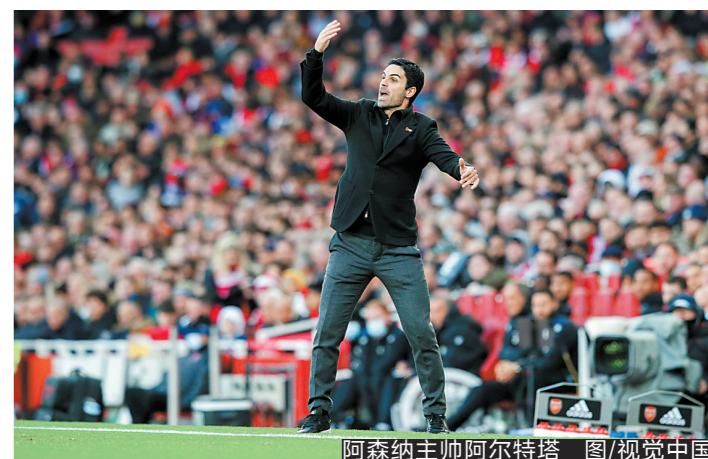
阿森纳主帅阿尔特塔