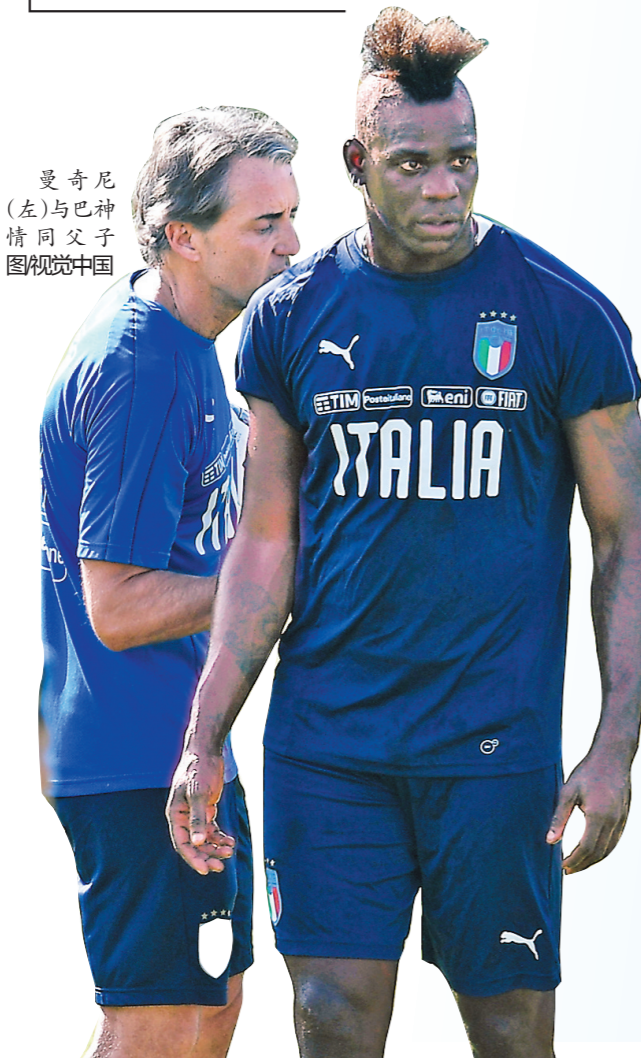
曼奇尼(左)与巴神情同父子