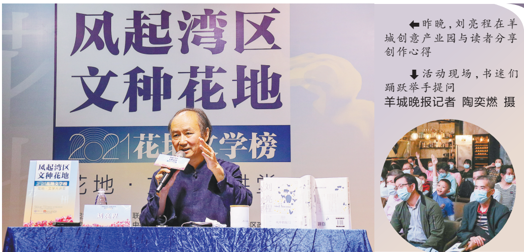
◀ 昨晚,刘亮程在羊城创意产业园与读者分享创作心得