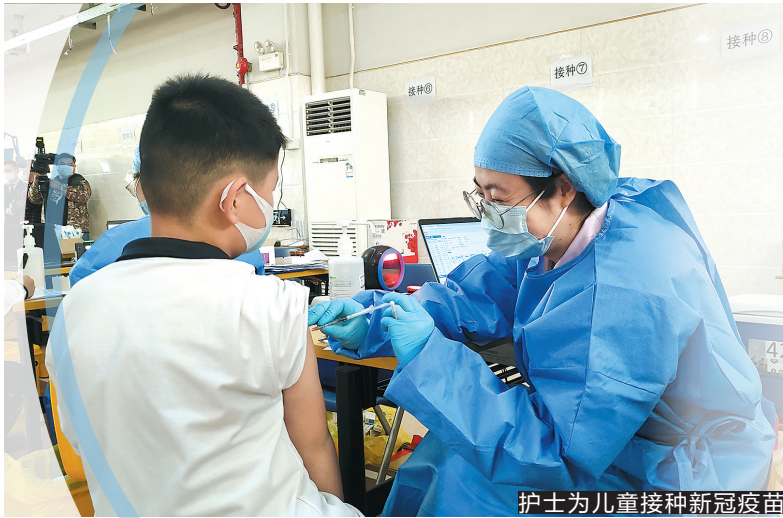
护士为儿童接种新冠疫苗

在开启第二针接种的同时,花都区同步为未接种第一针的3-11岁儿童进行补接种工作,目前全区3-11岁儿童已有19.85万余人完成第一针接种。