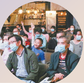
↓ 活动现场,书迷们踊跃举手提问