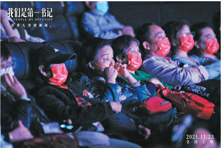
广州观众感动落泪

魏骅：如果是商业片，那么我们可能会加上轨道，会有灯光，导演会说演员演得不好就再来一次，